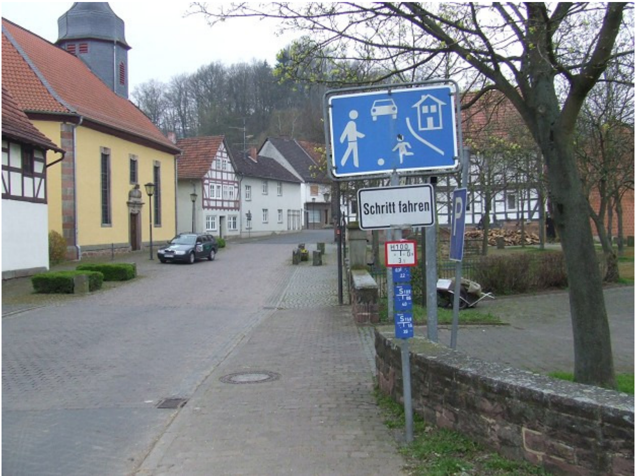
Beginn des verkehrsberuhigten Bereiches am Bahnübergang und der Nähe der Kirche von Unterhaun.