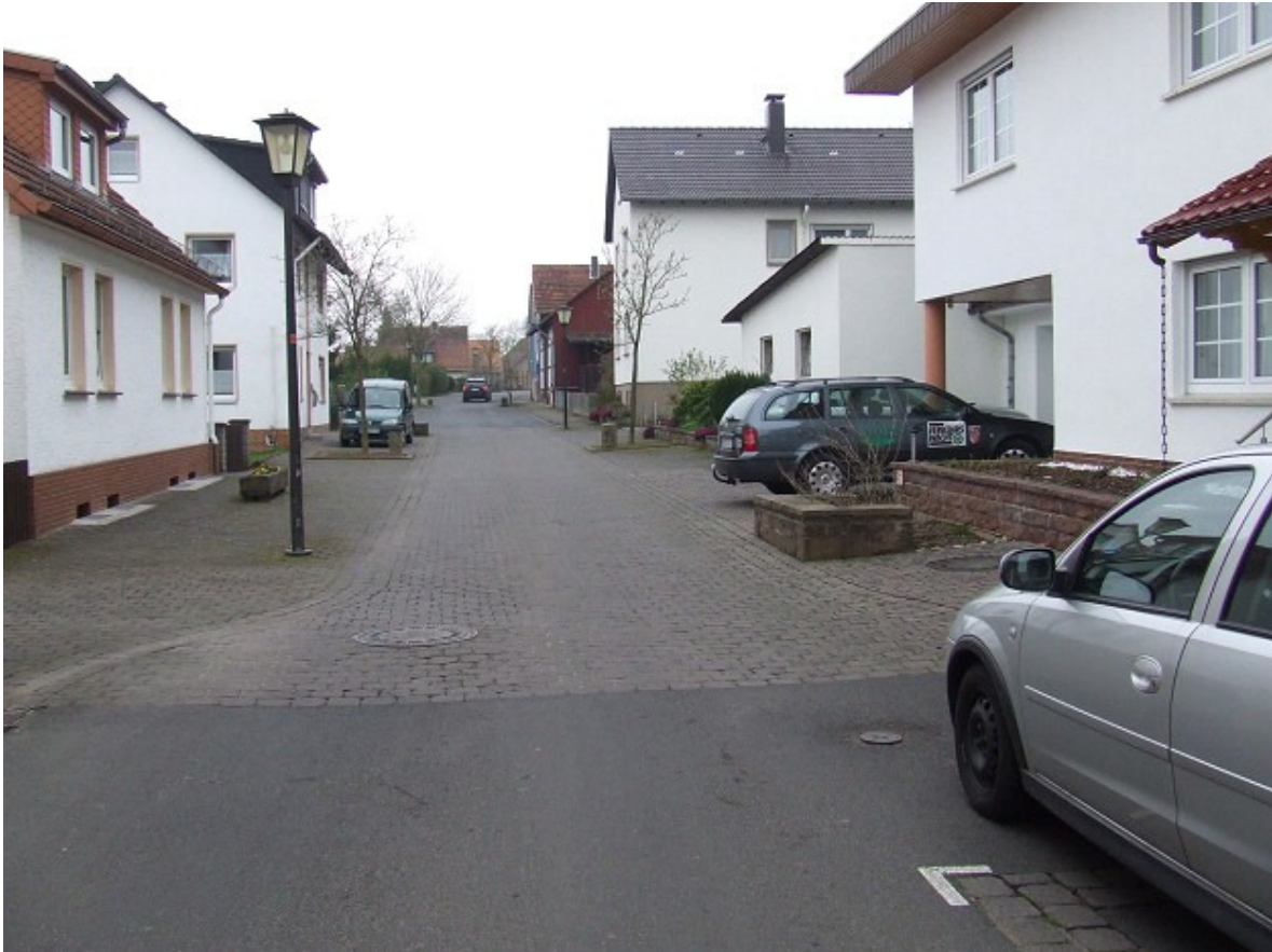
Kanaldeckel stehen hoch und darum befinden sich deutliche Vertiefungen und Verdrängungen.