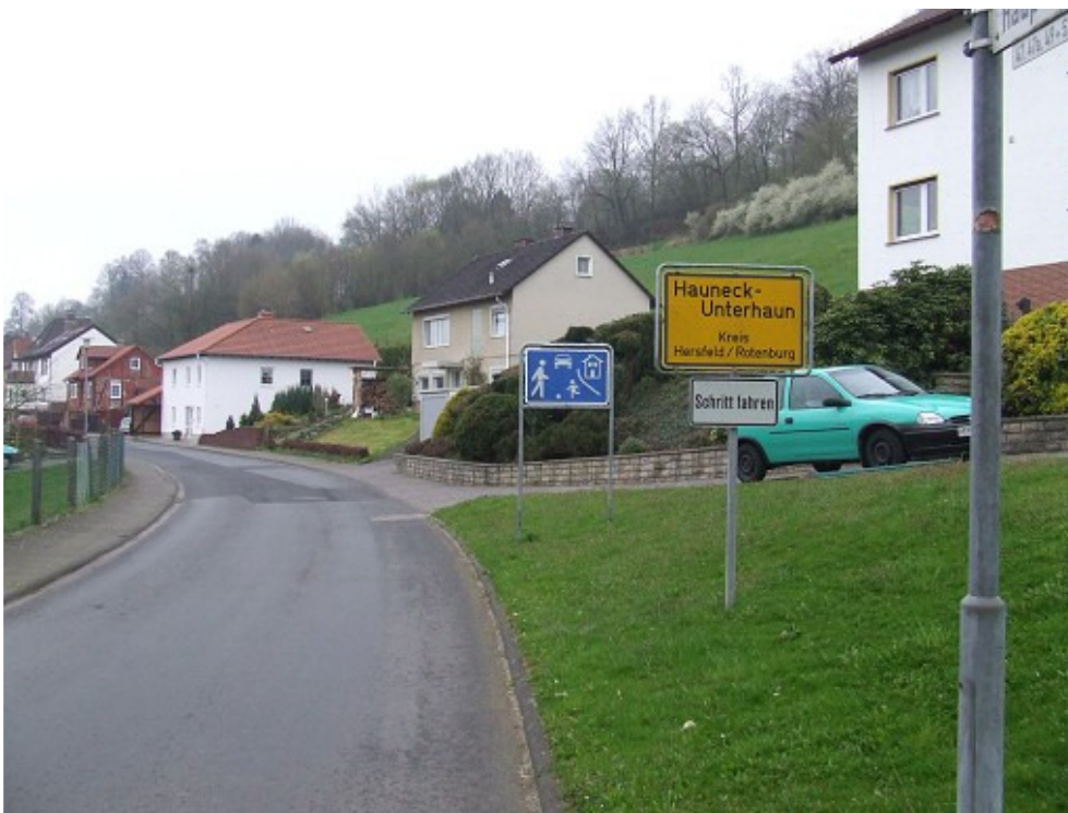
Beginn des verkehrsberuhigten Bereiches aus Richtung Bad Hersfeld kommend

In der Tat wird die gesamte Strecke, die mit viel Durchgangsverkehr belastet ist, sehr stark benutzt. Obwohl am Ortseingang aus Richtung Bad Hersfeld das Zeichen 325 StVO (verkehrsberuhigter Bereich) mit dem Zusatzschild (Schritt fahren) direkt hinter dem Ortsschild aufgestellt ist, halten sich mehr als 95 % der Kraftfahrer nicht an die gesetzliche Vorgabe und durchfahren den verkehrsberuhigten Bereich in voller Länge mit weit überhöhter Geschwindigkeit.